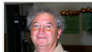
פרופ' זאב צחור שילום: חיים הורנשטיין

https://www.ynet.co.il/articles/0,7340,L-4911614,00.html